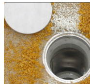
Grondpot tbv. incl. deksel